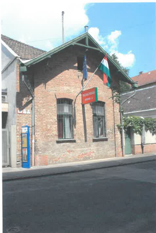
az északi szárny utcai oromfala