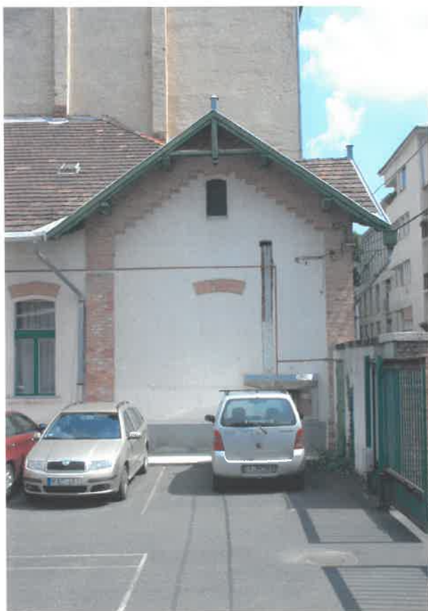
a déli szárny udvari homlokzata