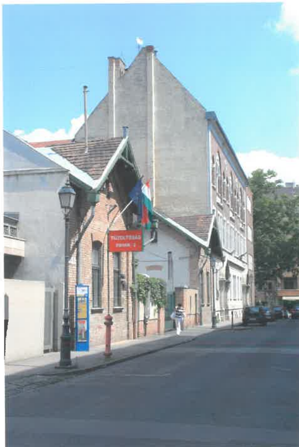
utcakép, Kosciuszkó T. u. 5-3.