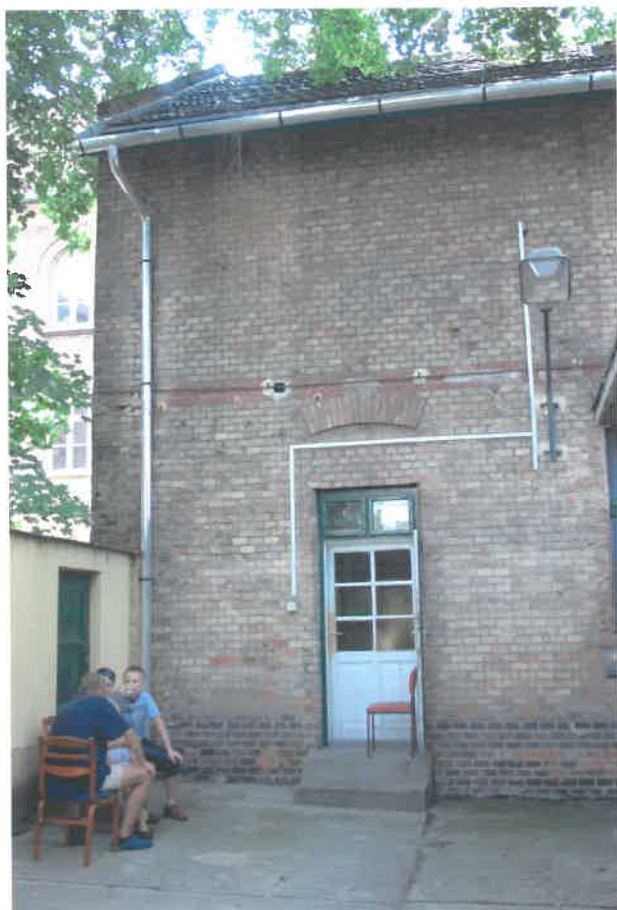
a keresztszárny a hátsó udvarból