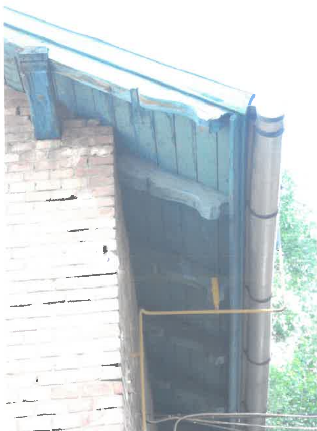
faragott tetőszerkezeti elemek a melléképületen