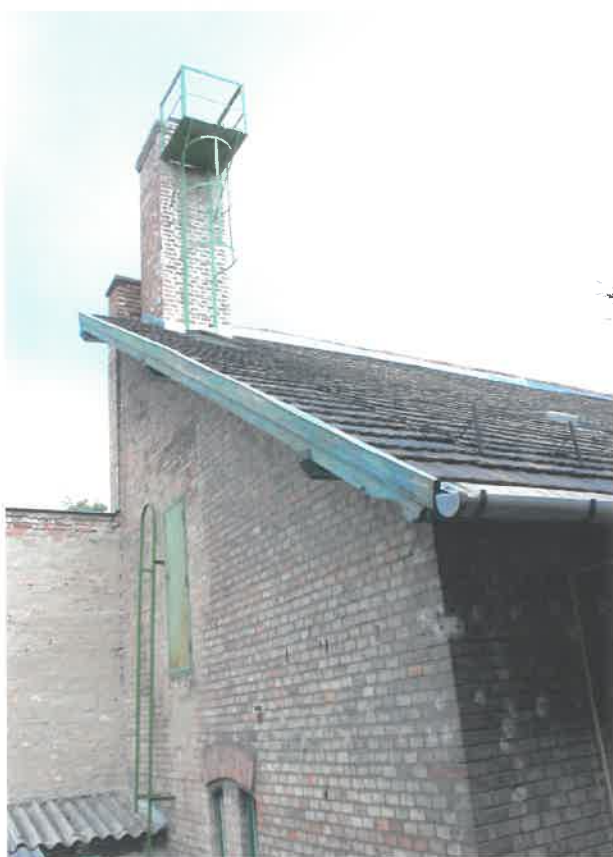
a melléképület északi oromfala