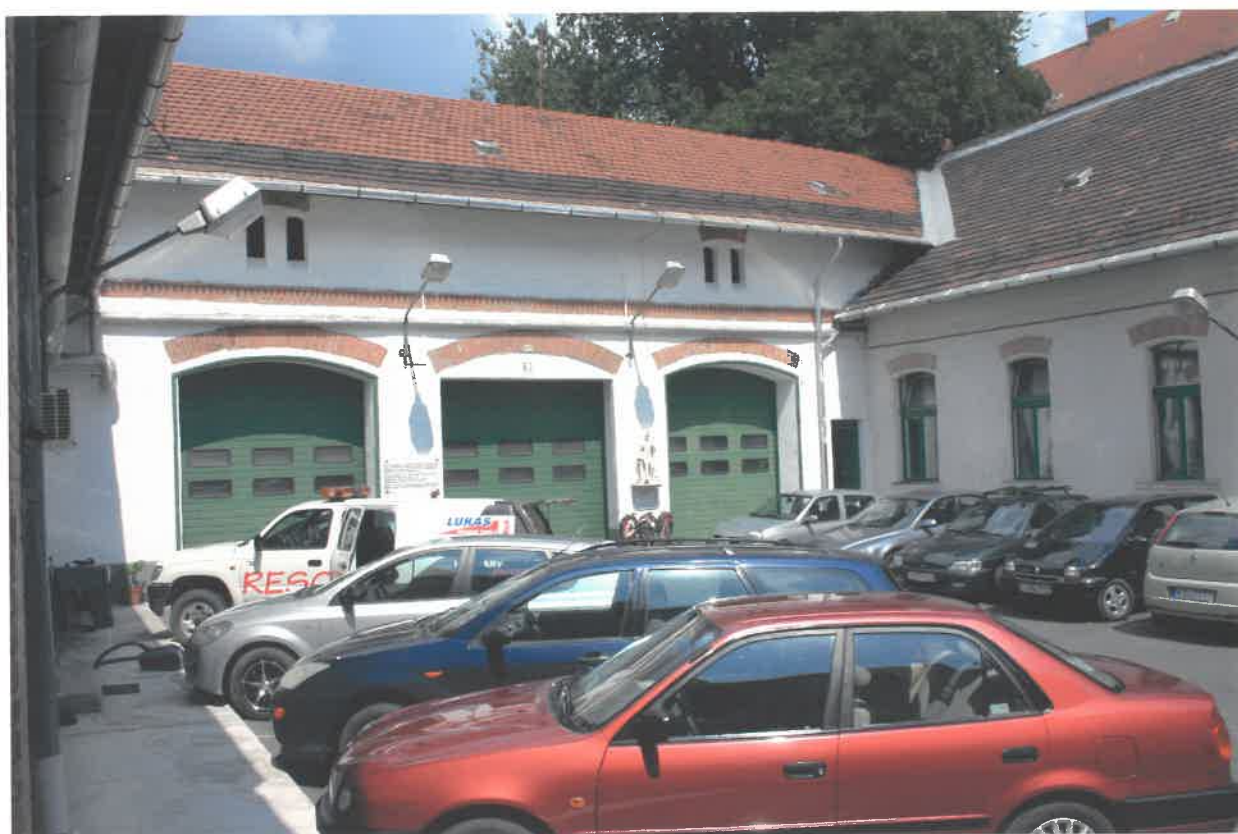
keresztszárny az új garázskapukkal