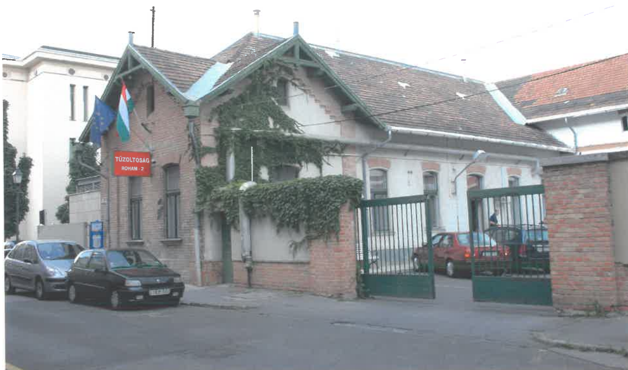
Kosciuszkó Tádé utcai északi szárny