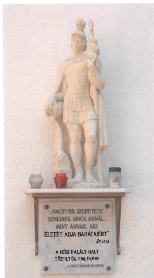
emléktábla a kereszt szárny falán