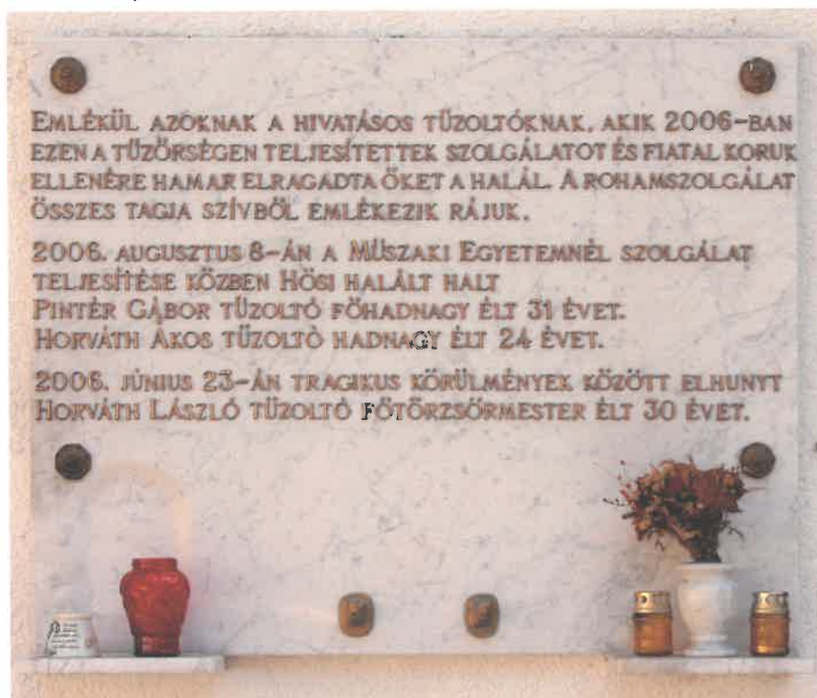
a 2007. február 23-án elhelyezett emléktábla