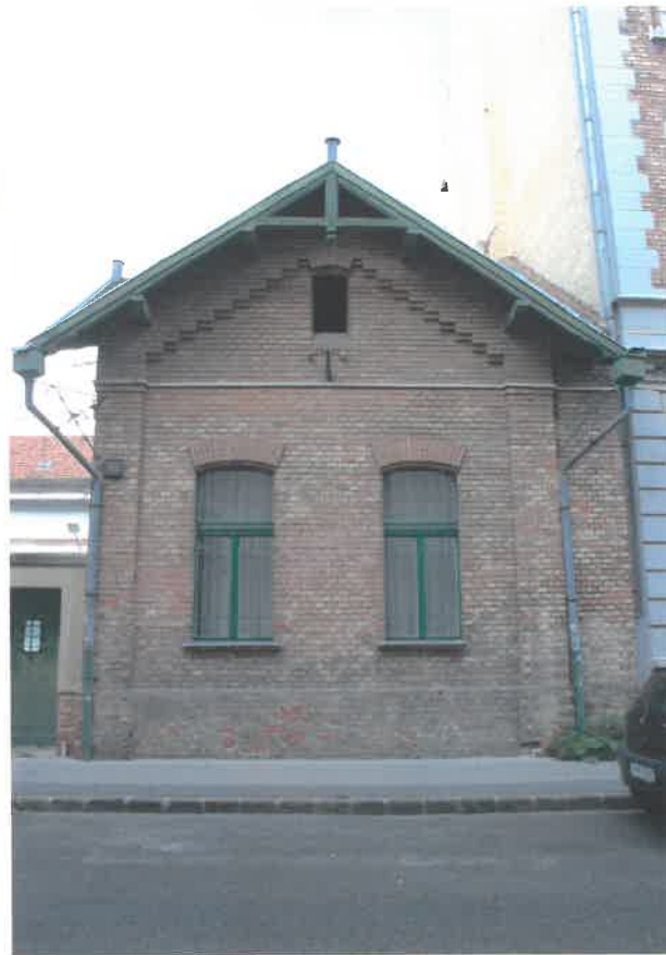
a déli szárny utcai oromfala