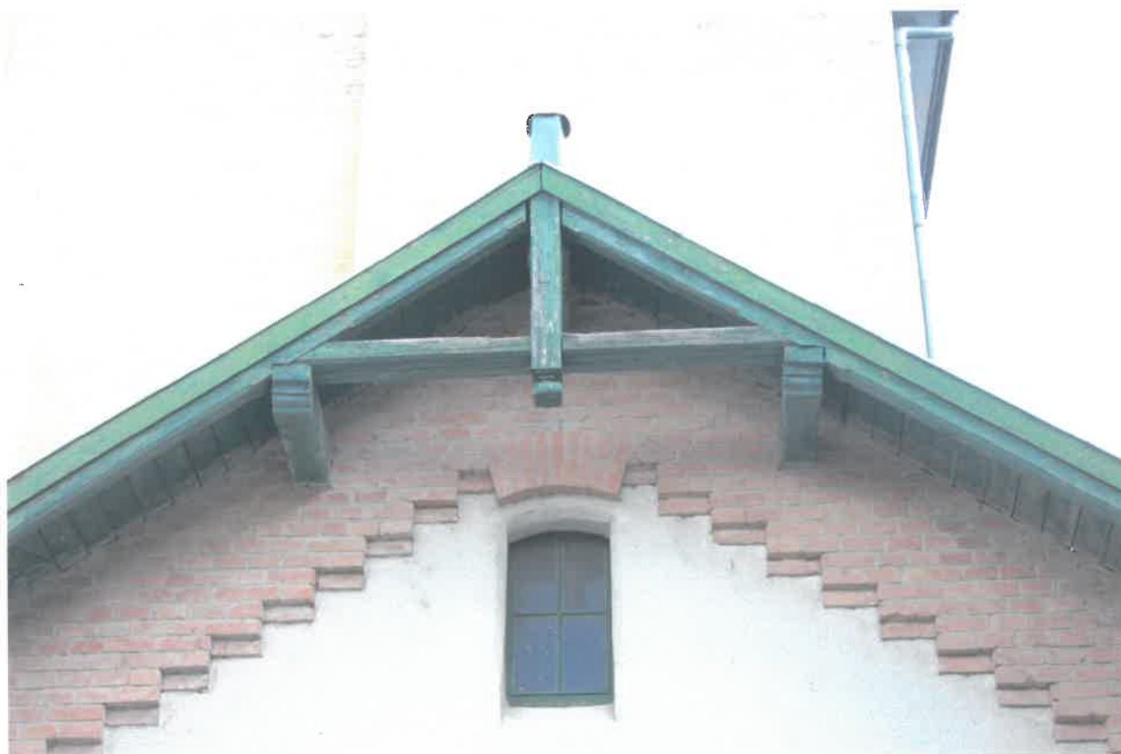
déli szárny, udvari oromfal részlete