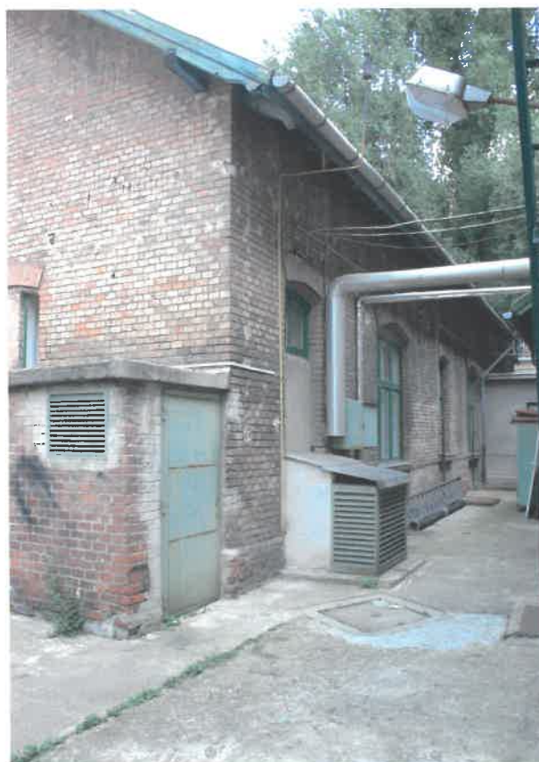
a melléképület északról