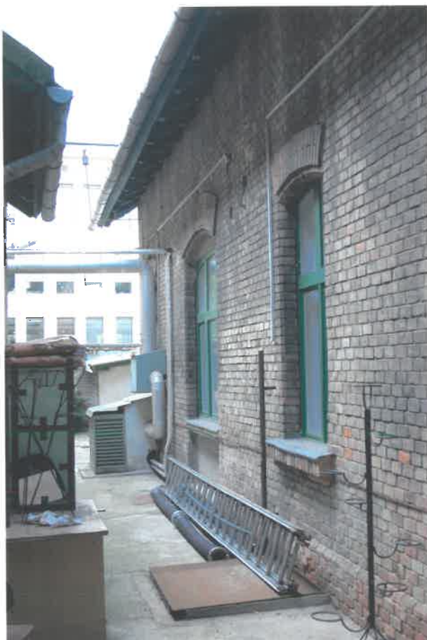
a melléképület homlokzata