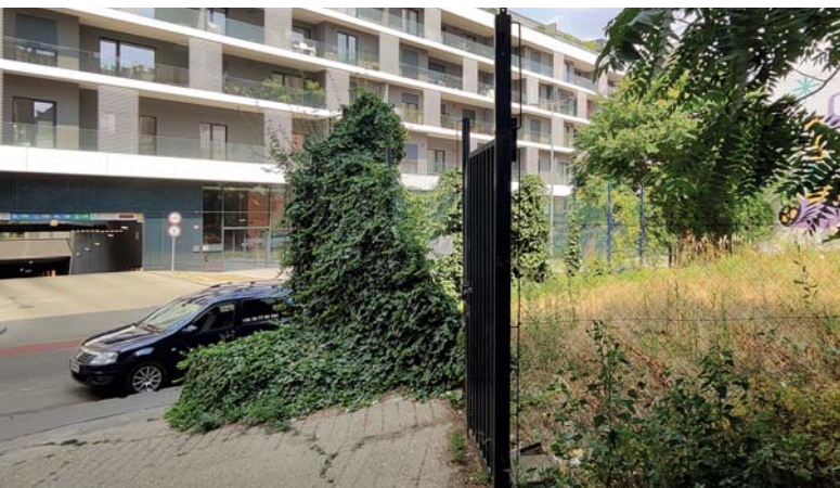
Nagy a kontraszt a szemközti új építésű, többfunkciós házzal