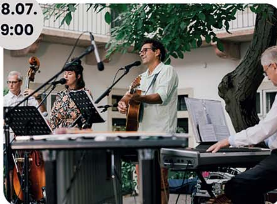
Cseh Tamás Projekt