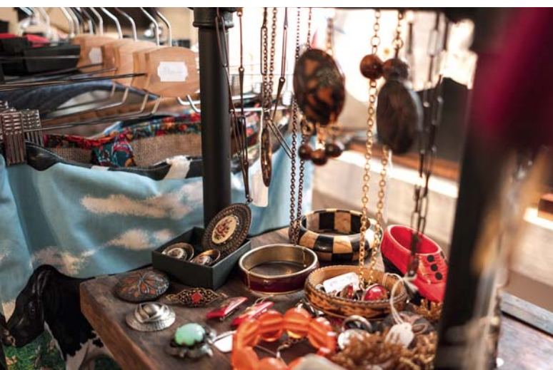
Ékszerek minden mennyiségben a piciny boltban

– Igen, sokszor jönnek be gyerekek is a szülőikkel, rácsodálkoznak a régi telefonra, hegedűre. Azt látom, hogy a környékbeli lakosok kimondottan szeretik ezt az antik vonalat.