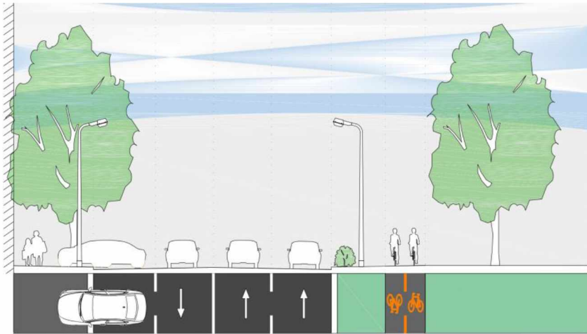
ATTILA ÚT (BUGÁT LÉPCSŐ - MIKÓ UTCA), JELEN