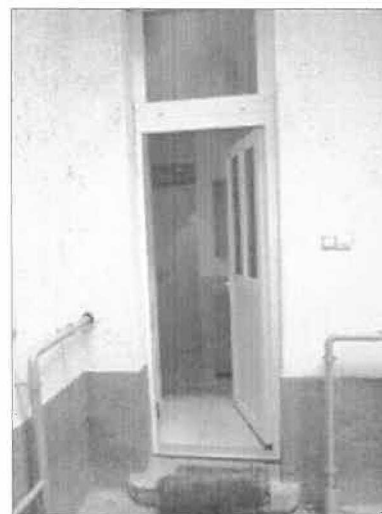
Lakás bejárat az udvarról